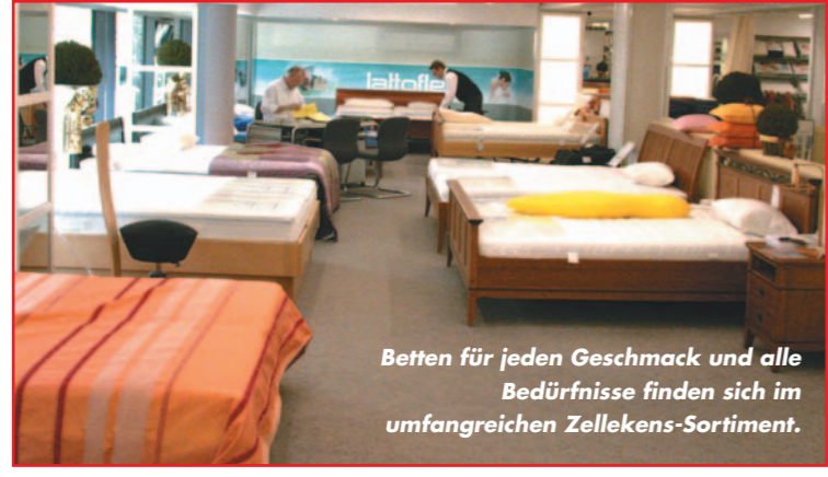
Betten für jeden Geschmack und alle Bedürfnisse finden sich im umfangreichen Zellekens-Sortiment.

lässt. Auch Wolle, Cashmere und Camelhaar sowie das Waschen von Daunen sind kein Problem für diese moderne Technik. Von der Beratung bis zum Folgeservice ist man bei Betten Zellekens – Hessens größtem Bettenhaus – an der richtigen Adresse.